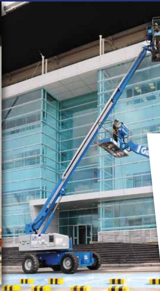
DIAGRAMA DE TRABAJO S-80